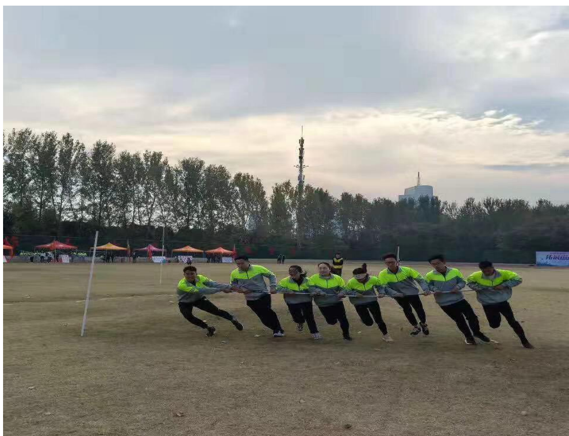
拓展运动会“旋风跑”项目