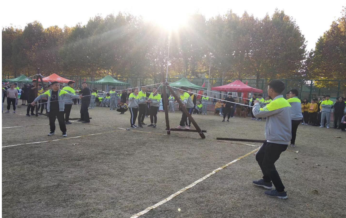
拓展运动会“先锋工程”项目