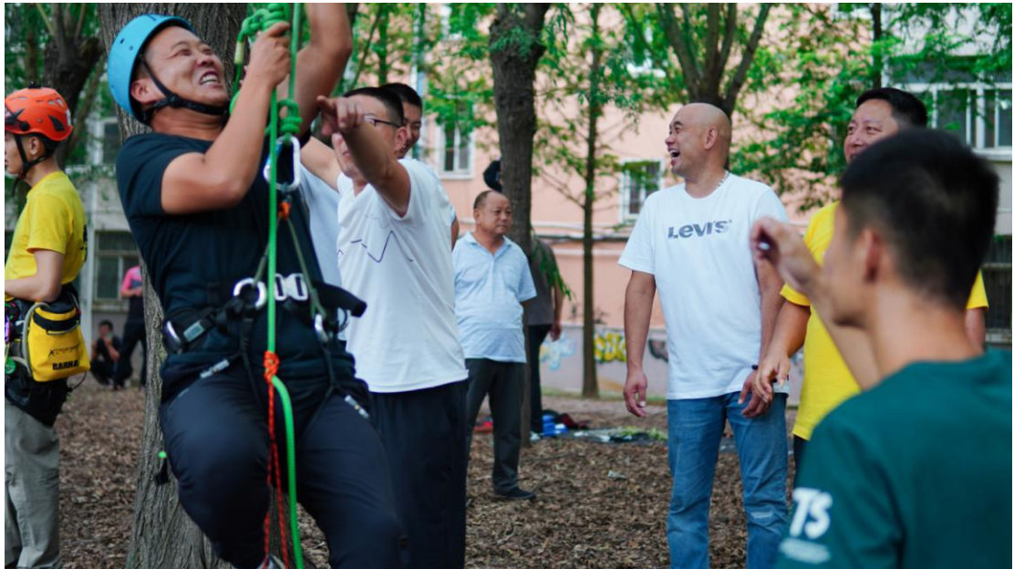
“国培计划 2020” 攀树课程