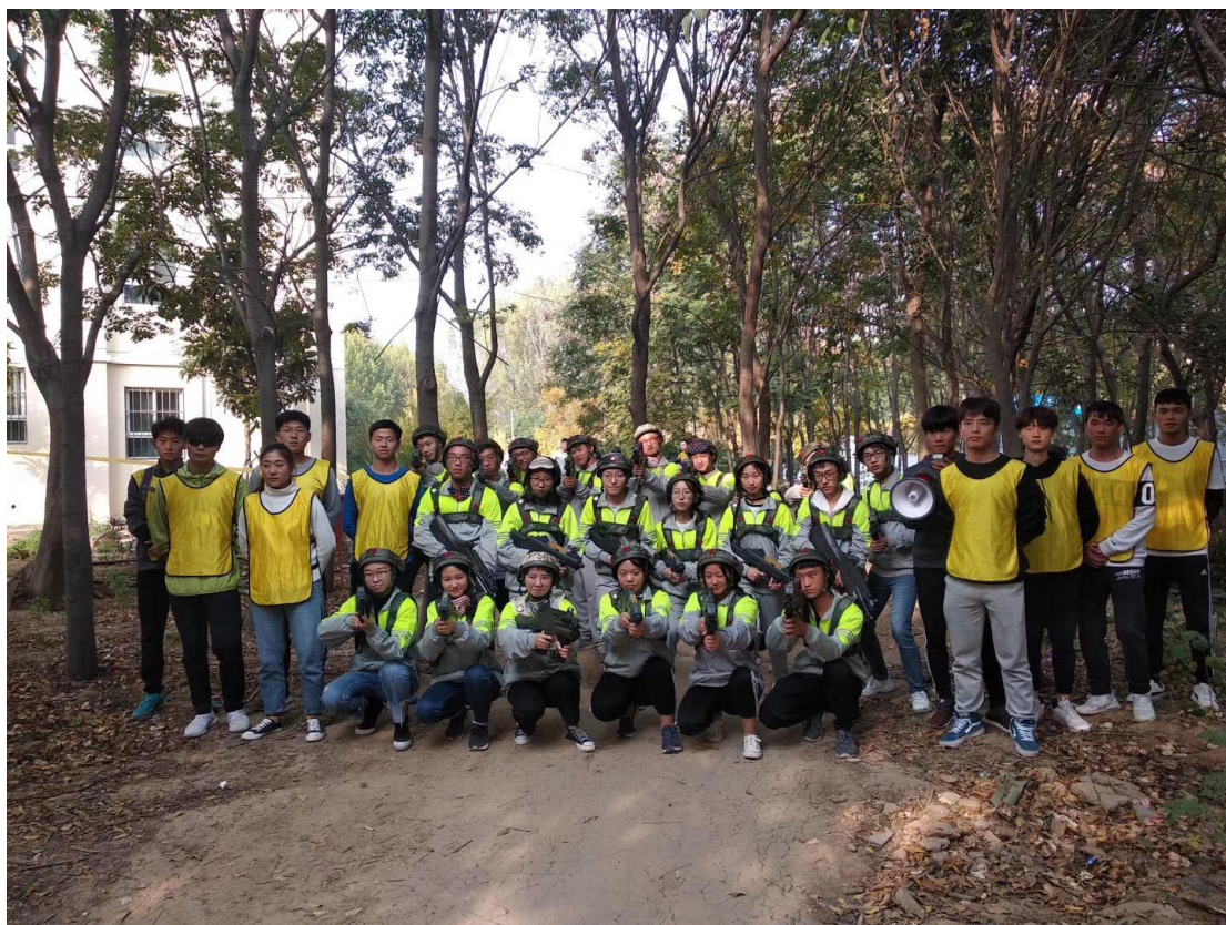
拓展运动会“CS野战”项目