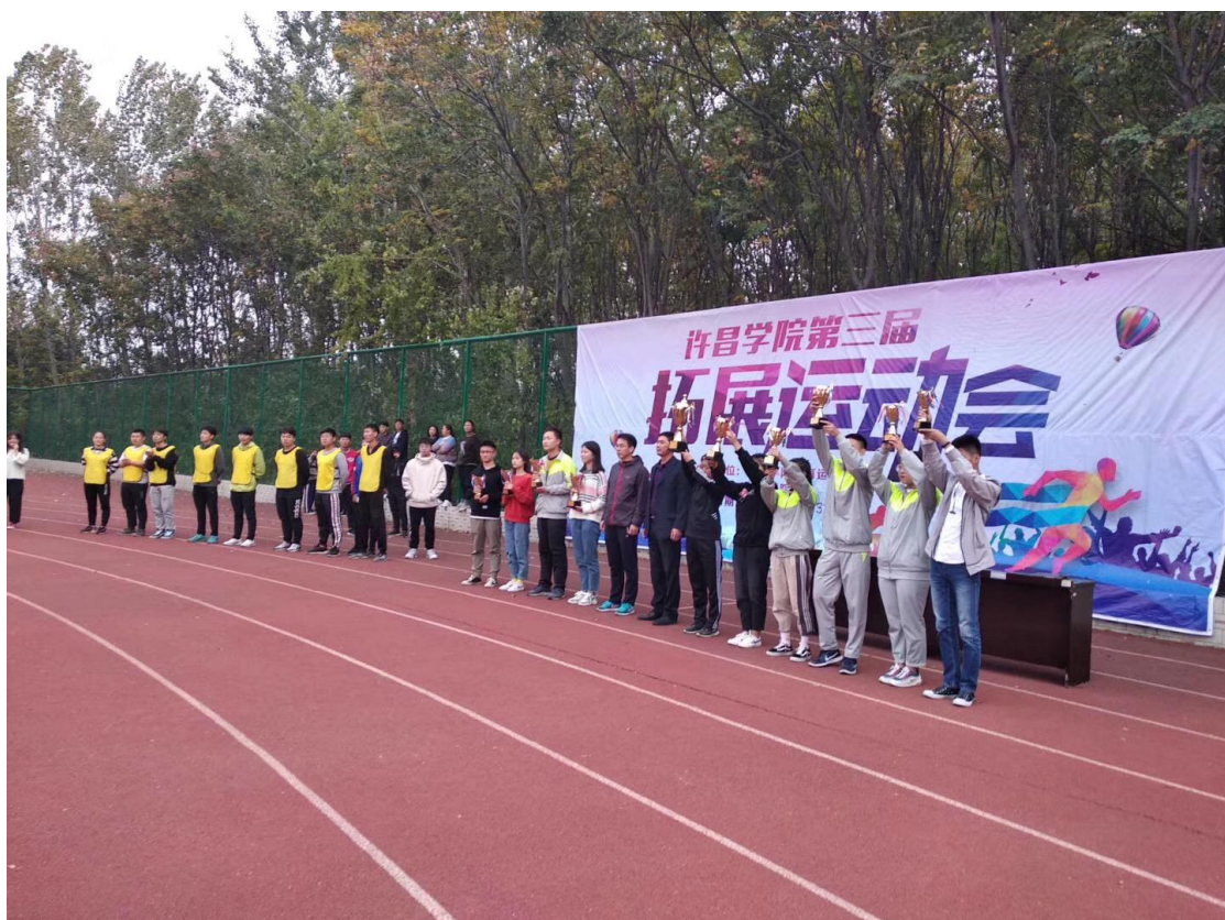
学院领导为拓展运动会获胜队伍颁奖