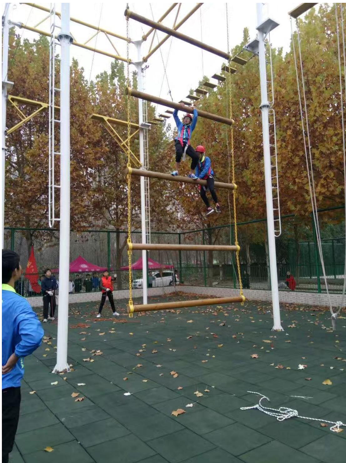
拓展运动会“垂直天梯”项目