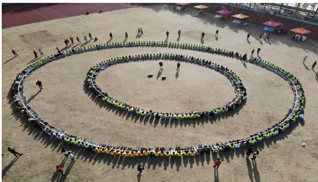
拓展运动会“巨人圈”项目