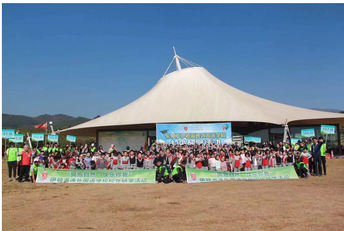
实习生带领青少年团队进行营地活动