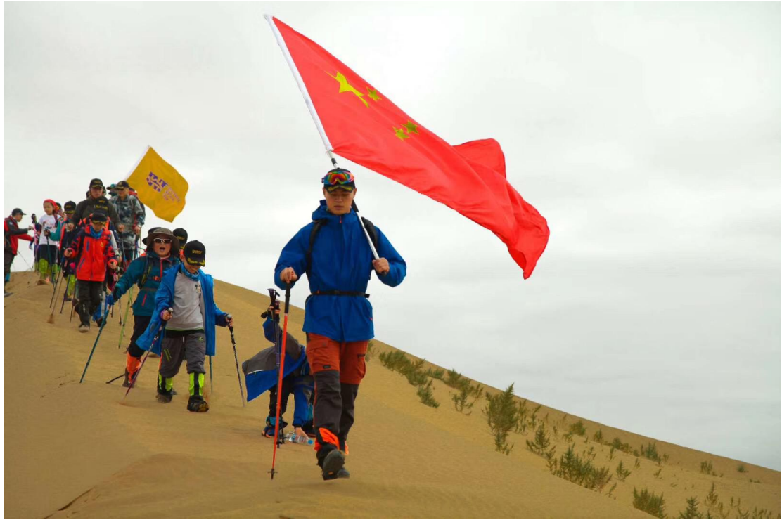
实习生带领青少年团队沙漠徒步