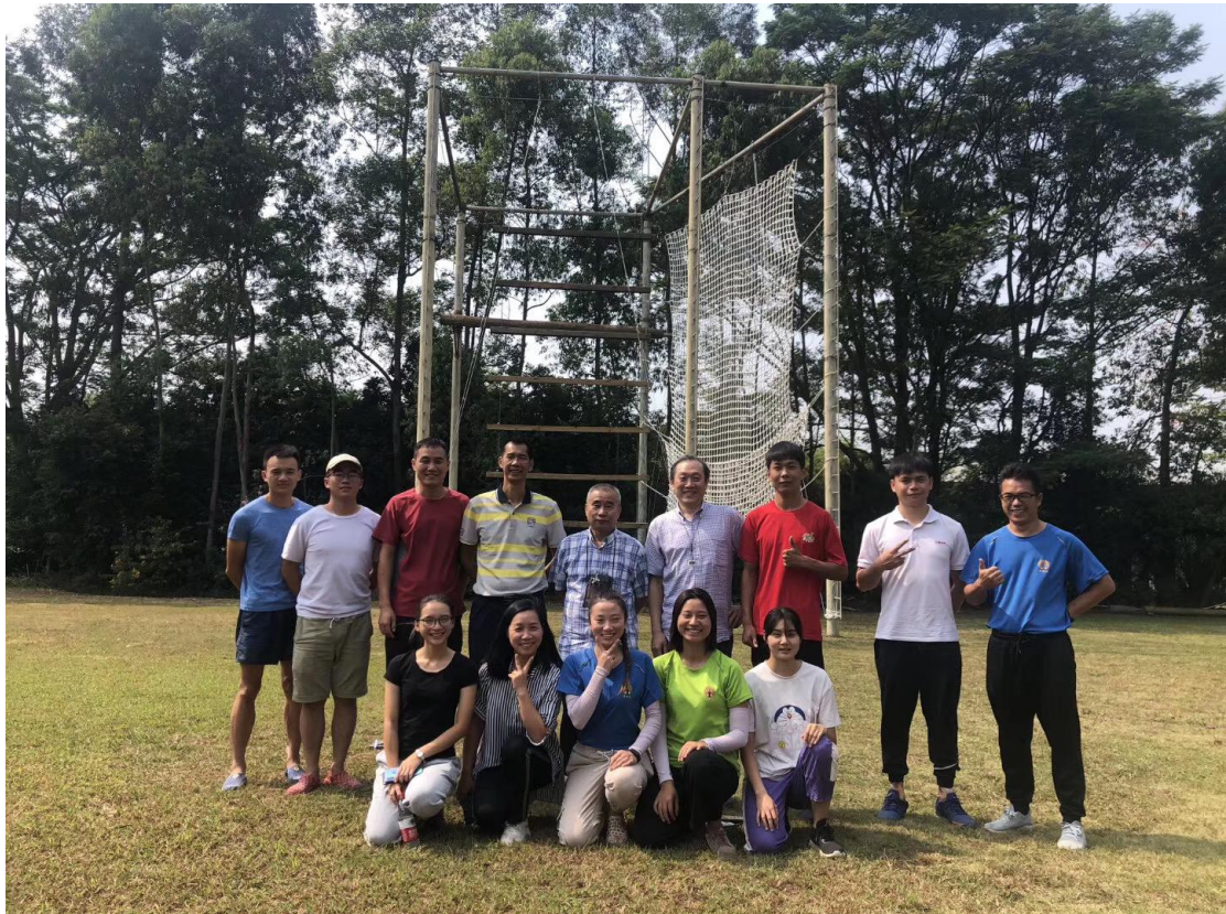
实习生带领公司团队进行团建