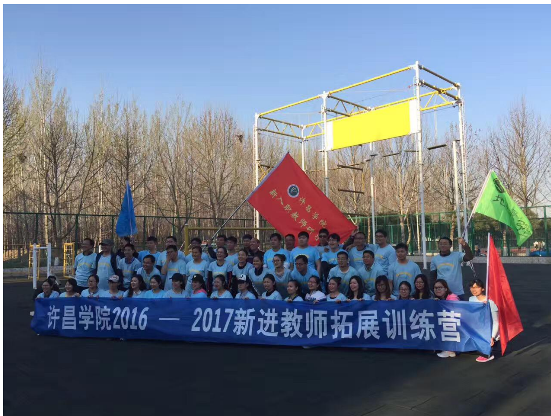
全校新进教师拓展培训