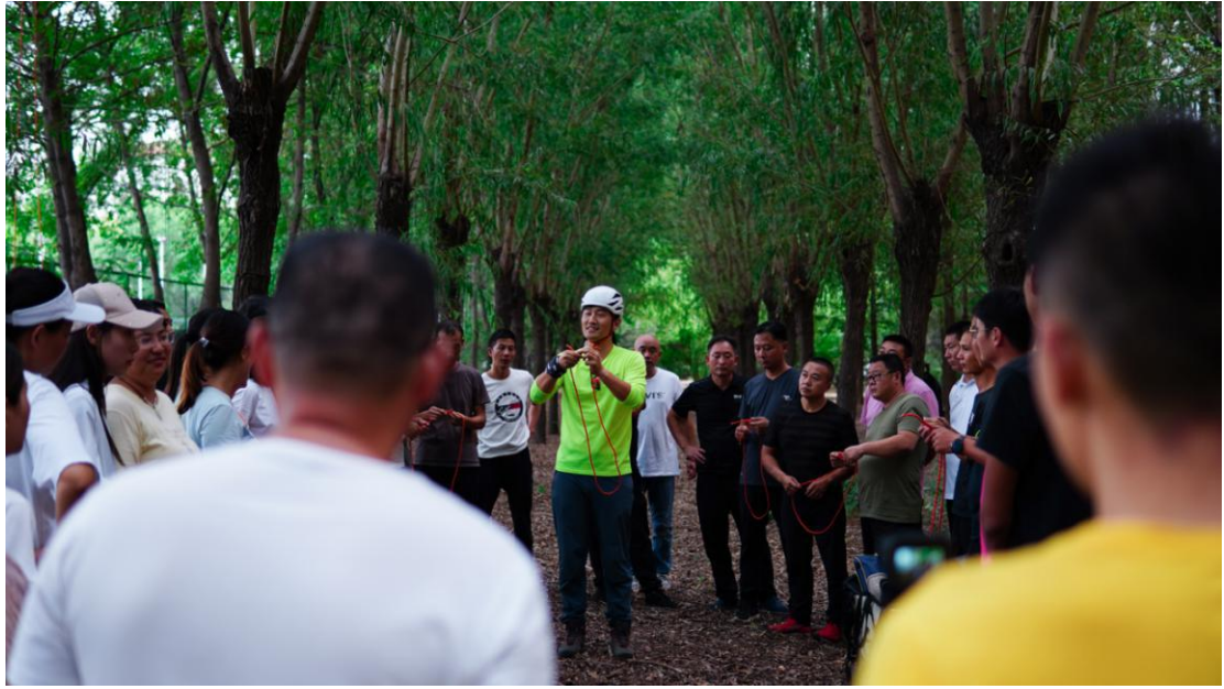
“国培计划 2020” 攀树课程