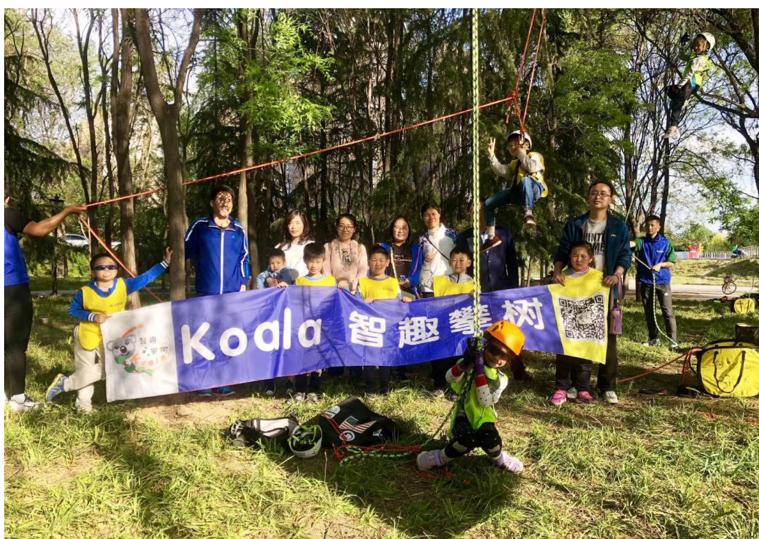
户外专业大学生创业项目“KOALA 智趣攀树”