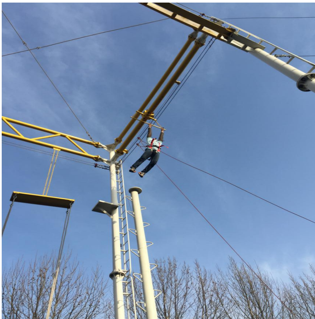
高空项目“空中抓杠”