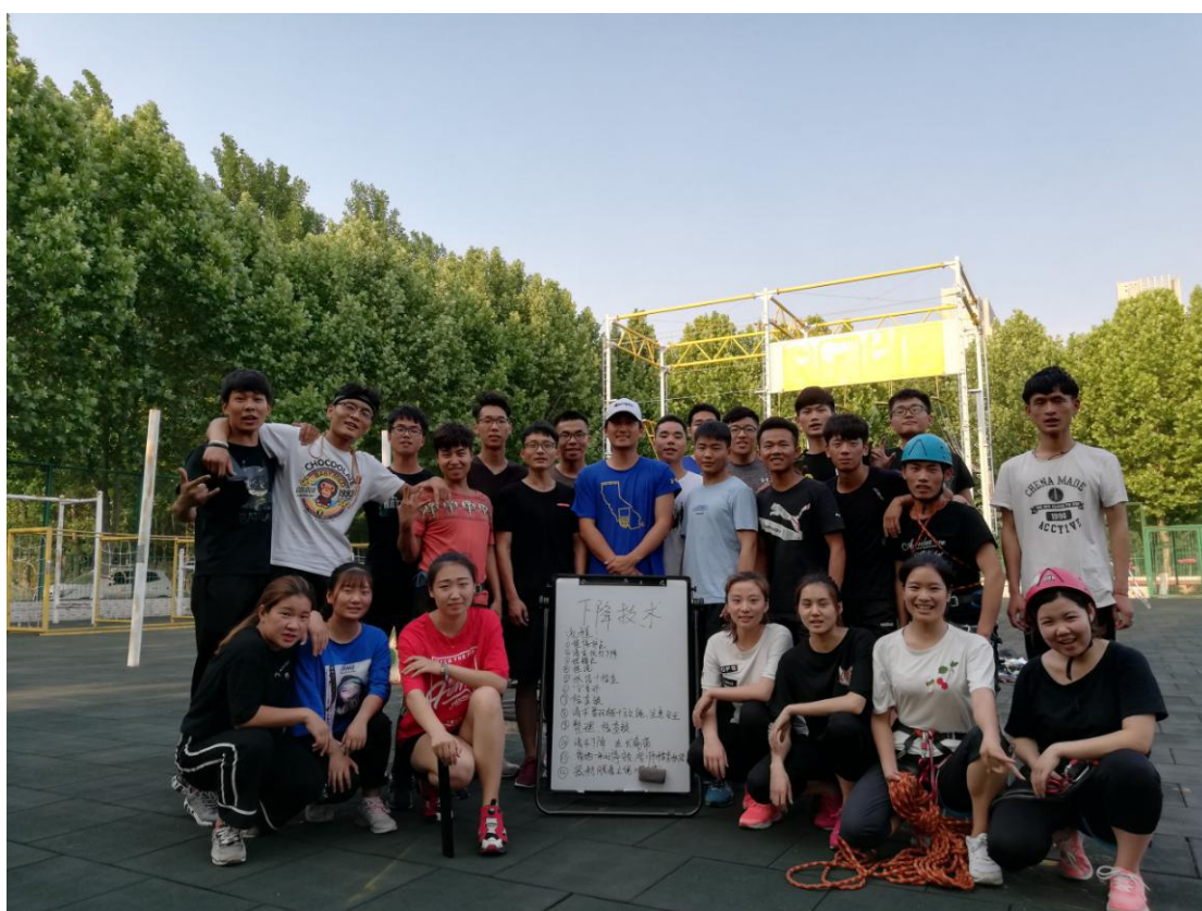
攀岩双绳下降技术